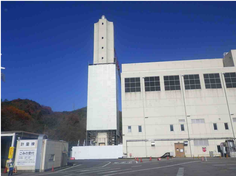
煙突養生足場組立中(平成28年12月14日 撮影)

現在、煙突解体工事の養生足場を組立中です。 H29年1月中旬より煙突の除染を行う予定です。